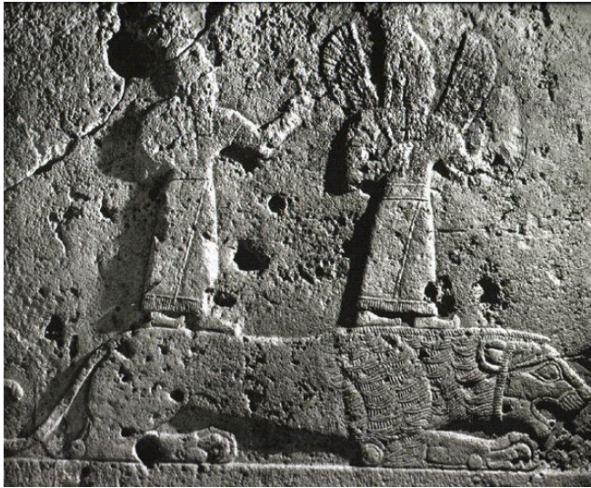
Photo : Relief de Karkémish représentant les dieux du Soleil et de la Lune

Université catholique de Louvain Collège Erasme ; Salle du conseil FIAL Place Blaise Pascal, 1 B-1348 Louvain-la-Neuve